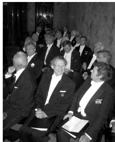
Ärkedjäknarna sitter bänkade i Solennitetssalen i väntan på att inskriptionen ska börja.

Upptredandet bestod av Floras och BD:s lystringssånger och en mäktig variant för blandad kör av Hymnen i Finlandia, i arrangemang av Gotti. De bekanta styckena behärskades väl och sången klingade fint mellan salens marmorväggar. Gotti var också nöjd: han vill hälsa att han gladdes åt att så många ställde upp, och att han var glad över att få träffa så många tidigare djäknar och över att vi sjöng så bra! Efter sjungningen fortsatte samvaron i glada tecken under en pyttipannasits på Kåren.