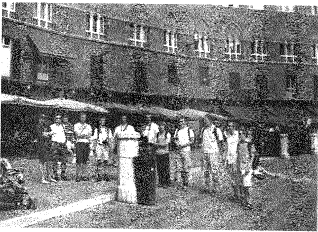
En tapper trippelkvartett sjunger på ett torg i Siena