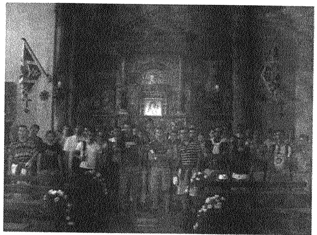
BD övar i Santa Maria de Fontegiusta

Nu hade djäknarna fått nog av dammiga berg och många kände redan längtan till öppna landskap. Vid Adriatiska havet ligger den historiska staden Fano som idag är en stor semester- och badort. Vårt hotell låg på stranden och trots det blåsiga och något kyliga vädret vågade sig många i havets brusande vågor. I staden höll en körfestival på att köra igång och vi skulle få den stora äran att medverka i festivalens öppningskonsert. Incontro Internazionale Polifonico Città di Fano -festivalen ordnades nu för 34:e gången. BD fick än en gång uppträda för en fullsatt kyrka och även här bjöd den lokala kören oss på fest efter den lyckade konserten.