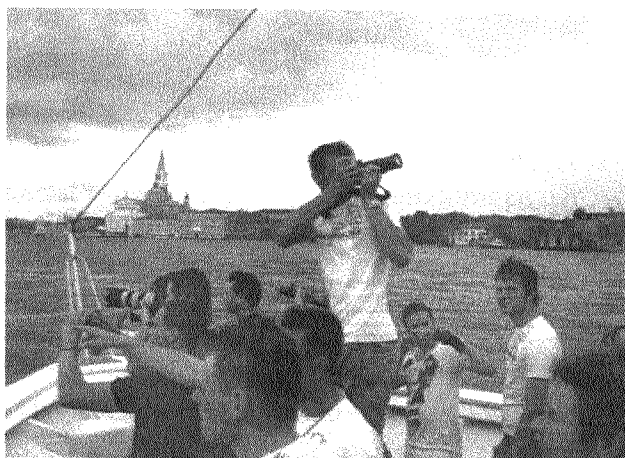
Båttransport till Venedig

Vi hade en egen buss till förfogande under turnén vilket underlättade förflyttningarna men i Venedig hade vi dock ingen större nytta av denna landsvägsbuss och under första dagen hyrde vi en båtbuss för transport till och från staden. Detta p.g.a. att dagen var fullspäckad med program: övning, deltagande i kvällsmässan i Basilica di San Marco, utomhuskonsert på Campo Santo Stefano och sist men inte minst, sitta på en av stadens många läckra restauranger. Dagen därpå var lyckligtvis ledig och då hade vi chansen att vara regelrätta turister från morgon till kväll. Det enda organiserade den dagen var en rundtur kring staden i en båt som kören hade hyrt och där blev vi bjudna på både drycker och guidning i strålande solsken. Toscana var näst på tur och på morgonen den första september åkte vi iväg från Venedig mot Siena.