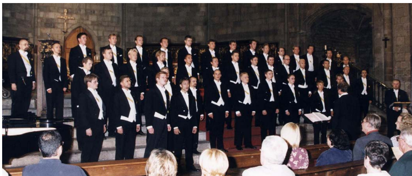
BD uppträder i katedralen Santa Maria del Pi under körens senaste besök i Barcelona hösten 2000.